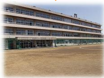
宗岡第二中学校 学校運営協議会