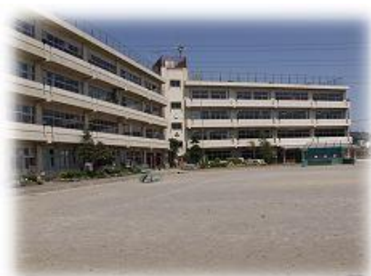
宗岡小学校 学校運営協議会