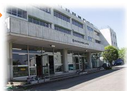
宗岡第三小学校 学校運営協議会