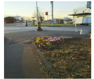
交差点付近の植栽

さて、年始にはサウジアラビアとイランの国交断絶や北朝鮮による核実験など、年末から年始にかけて不穏な動きが世界でありました。そんな中、国内では本校の卒業生が活躍している報道もありました。